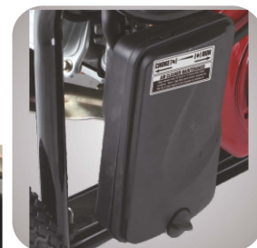
Filtru de aer patentat