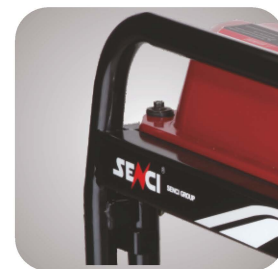
Cadru tratat pentru a preveni ruginirea